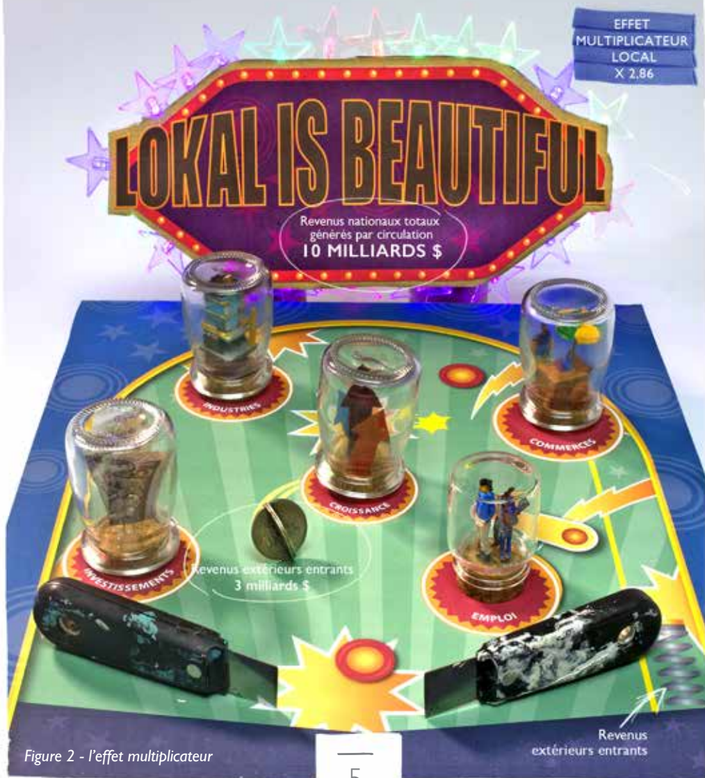
Figure 2 - l'effet multiplicateur

La prospérité de Maurice est donc à la fois le produit de son rayonnement international et de sa capacité à maximiser l'effet multiplicateur. A titre d'exemple, Maurice a sur l'année 2015 capté près de 3.42 Mds USD de revenus à l'international. En faisant circuler cet argent entre les acteurs de l'économie locale, à l'image d'une bille dans un flipper qui tant qu'elle reste en jeu permet d'accumuler des points (cf. figure 2), l'effet multiplicateur a permis à Maurice de multiplier par 2,86 ces revenus captés à l'international pour atteindre près de 10,3 Mds USD de revenu national.