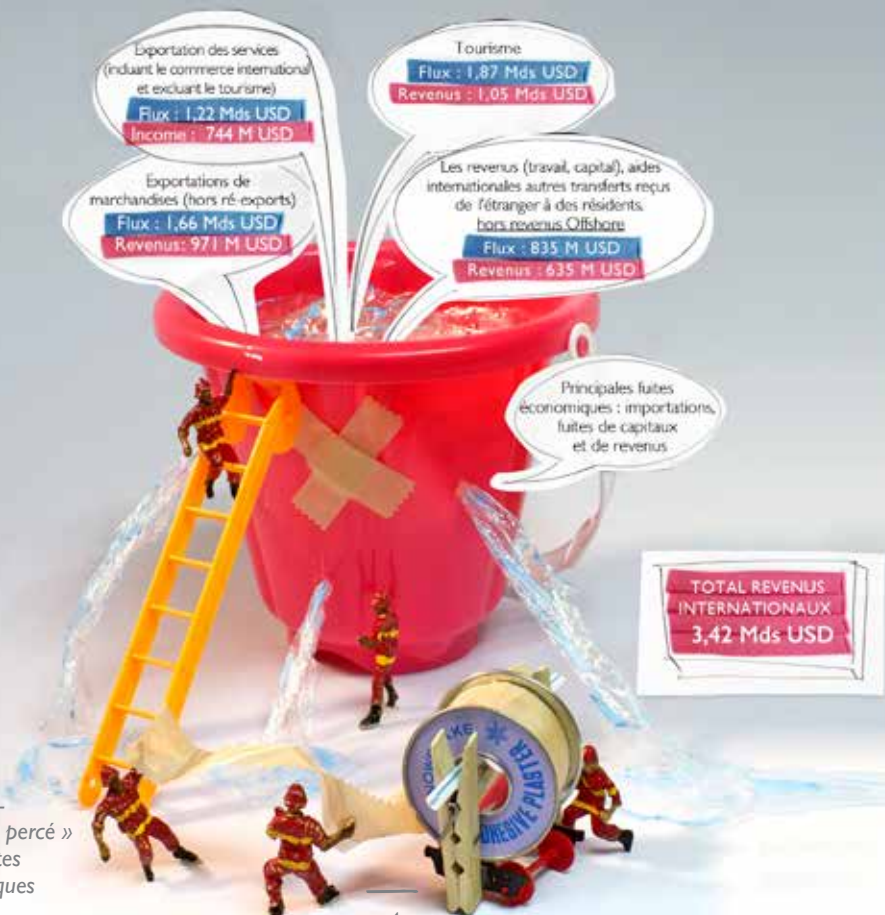
Figure 1 - le « seau percé » et les fuites économiques

Les revenus de Maurice s'expliquent en effet par la capacité de l'île à capter des revenus internationaux (exportations, revenus du travail, capital) mais aussi à les faire circuler localement : les revenus qui entrent sur le territoire vont générer d'autres richesses locales, entraînant, par un effet vertueux, de nouveaux échanges et de nouveaux revenus... jusqu'à ce que l'effet ricochet s'estompe. C'est ce que l'on appelle l'effet multiplicateur. Cet effet multiplicateur sera d'autant plus élevé que le territoire est capable de limiter les fuites de richesses (importations, revenus payés aux investisseurs étrangers...). Sans cet effet, le territoire fonctionne un peu comme un seau percé, qui n'arrive à garder les richesses qui y entrent et à en faire profiter son économie locale (voir figure 1).